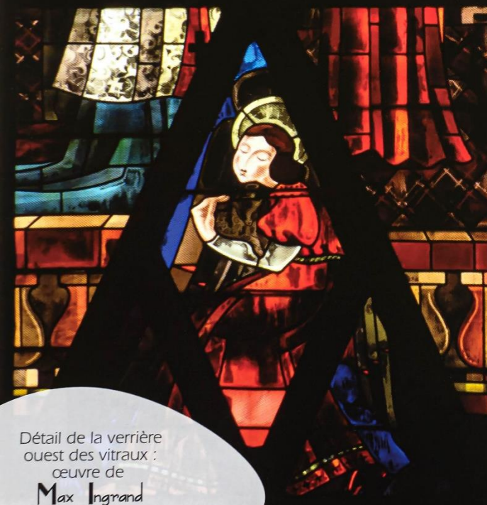
Détail de la verrière ouest des vitraux : œuvre de Max Ingrand